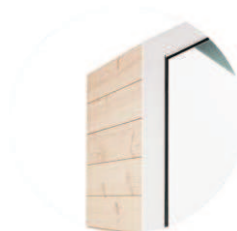
THS [...] W